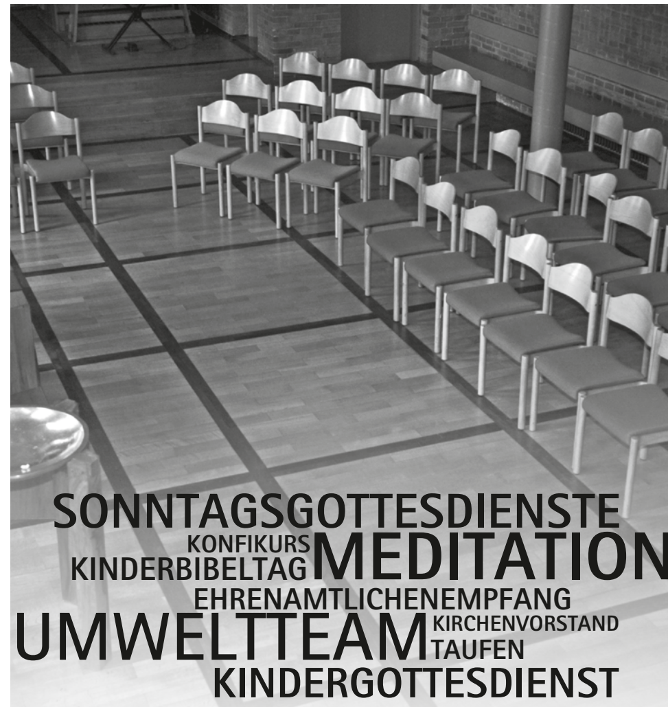
GEMEINDEHAUS ST. MARTIN

pelle im Quartier, die leicht zu übersehen ist. Das Platzangebot wird abgerundet durch das Gemeindehaus St. Lukas, das aus dem Ensemble prächtiger Bürgerhäuser der Gründerzeit heraussticht, weil es im Stil der frühen 70er mit den Errungenschaften der Moderne (Aufzug und Tiefgarage) gebaut wurde. Was an Gruppen, Aktivitäten und Veranstaltungen alles seinen Platz hier hat ist beachtlich.