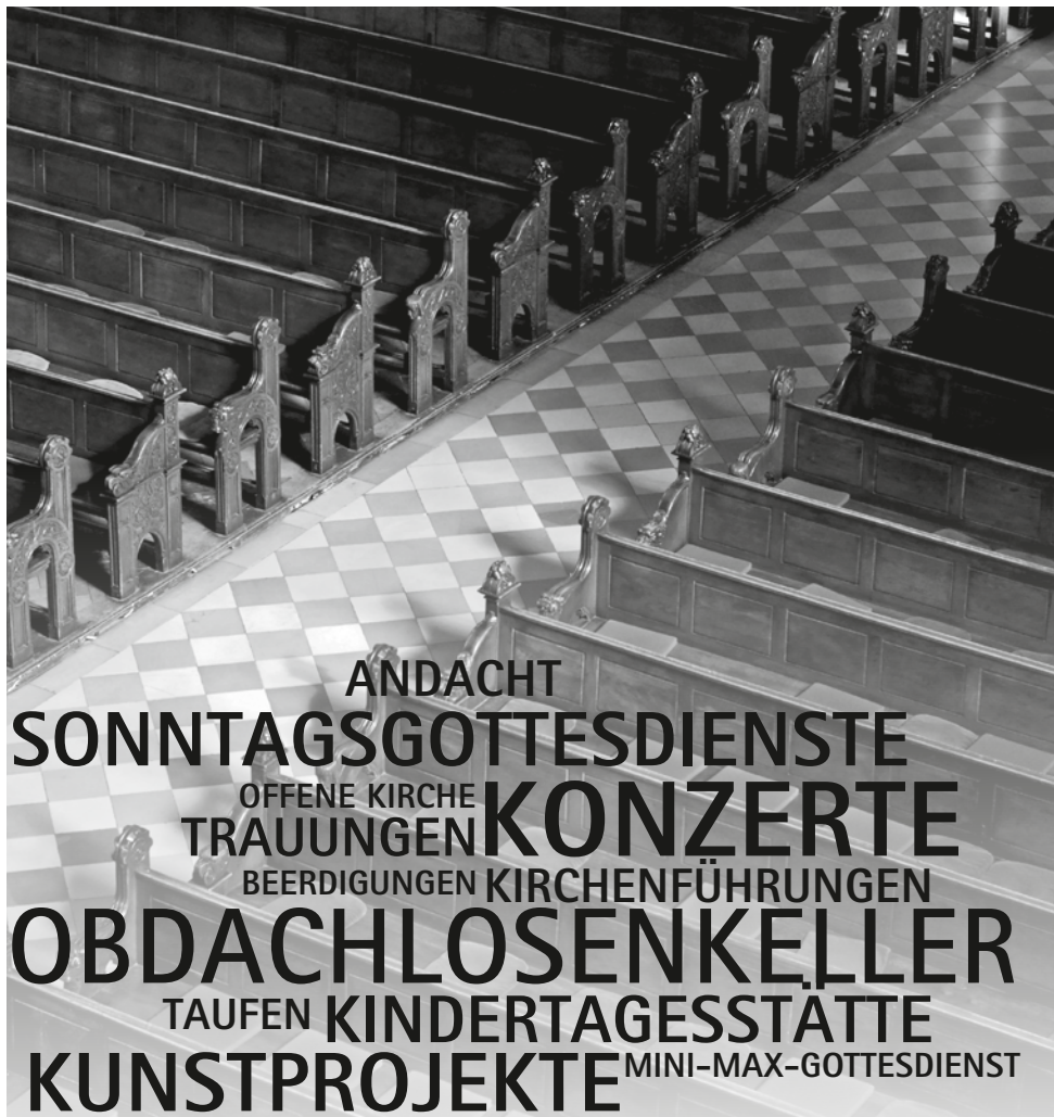
KIRCHE ST. LUKAS

pelle im Quartier, die leicht zu übersehen ist. Das Platzangebot wird abgerundet durch das Gemeindehaus St. Lukas, das aus dem Ensemble prächtiger Bürgerhäuser der Gründerzeit heraussticht, weil es im Stil der frühen 70er mit den Errungenschaften der Moderne (Aufzug und Tiefgarage) gebaut wurde. Was an Gruppen, Aktivitäten und Veranstaltungen alles seinen Platz hier hat ist beachtlich.